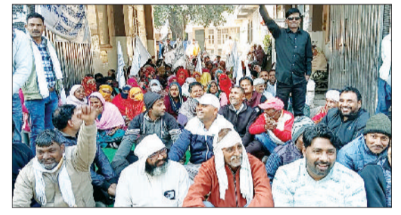
बहादुरगढ़। नगर परिषद के गेट पर धरना प्रदर्शन करते हुए सफाई कर्मचारी।