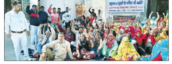
झज्जर। नगर परिषद परिसर में धरना प्रदर्शन करते हुए सफाई कर्मचारी।