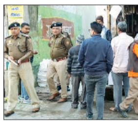
सिलानी गेट पर जांच करती पुलिस।