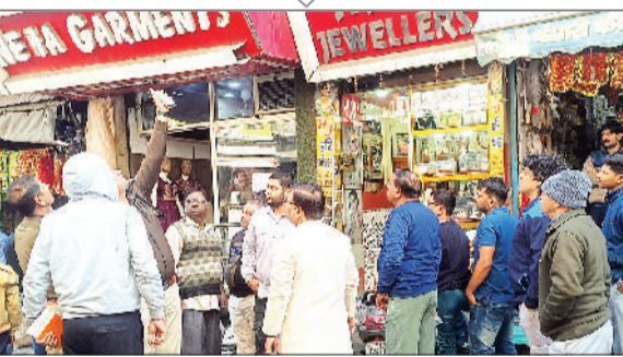
बहादुरगढ़। दुकानों के बाहर मौजूद पुलिस, दुकानदार व अन्य।

ज्वेलरी शोरूम में तीसरी बार हुआ वारदात का प्रयास, सुरक्षा की मांग