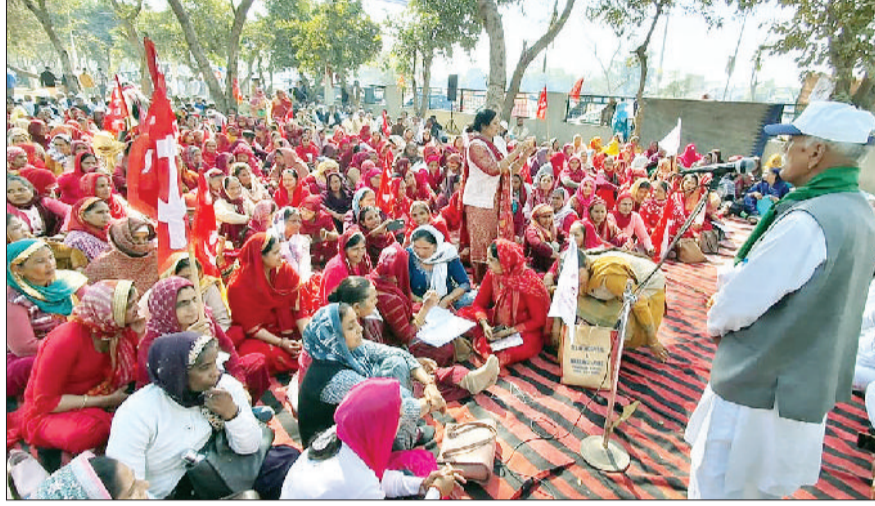
झज्जर। लघुसचिवालय परिसर के नजदीक ग्रीन बेट में धरनास्त कर्मियों को संबोधित करते कर्मचारी नेता।